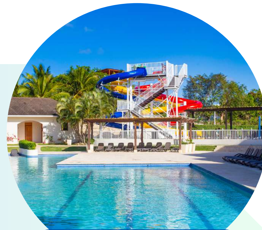
AL PORTO CLUB HOUSE